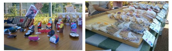
福祉作業所による物品販売