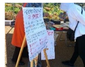
環境団体による啓発活動