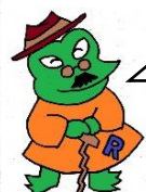
ヘラスンジャーパパ

フードドライブとは、家庭で余っている食べ物を持ち寄り、それらを福祉団体や施設、フードバンクなどに寄付する活動のことじゃ。小平市では、食品ロス(まだ食べられるのに捨てられている食品)を削減するため、フードドライブ活動に取り組んでおるぞ。