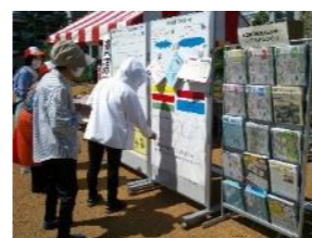
来場者シールアンケート

今後も、毎年5月30日「ごみゼロの日」に近い5月下旬頃にリサイクルセンター広場で開催される予定です。