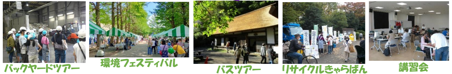
バックヤードツアー 環境フェスティバル バスツアー リサイクルきゃらばん 講習会