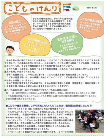
こどものけんりつうしん