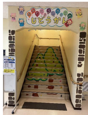
おがわちやうにちやうめ 小川町二丁目児童館