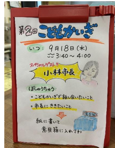
児童館のこども会議